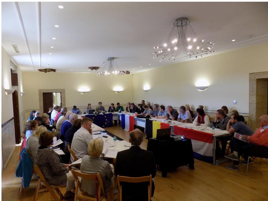
27/10/2016: Reunión de trabajo en el Pazo de Liñares.