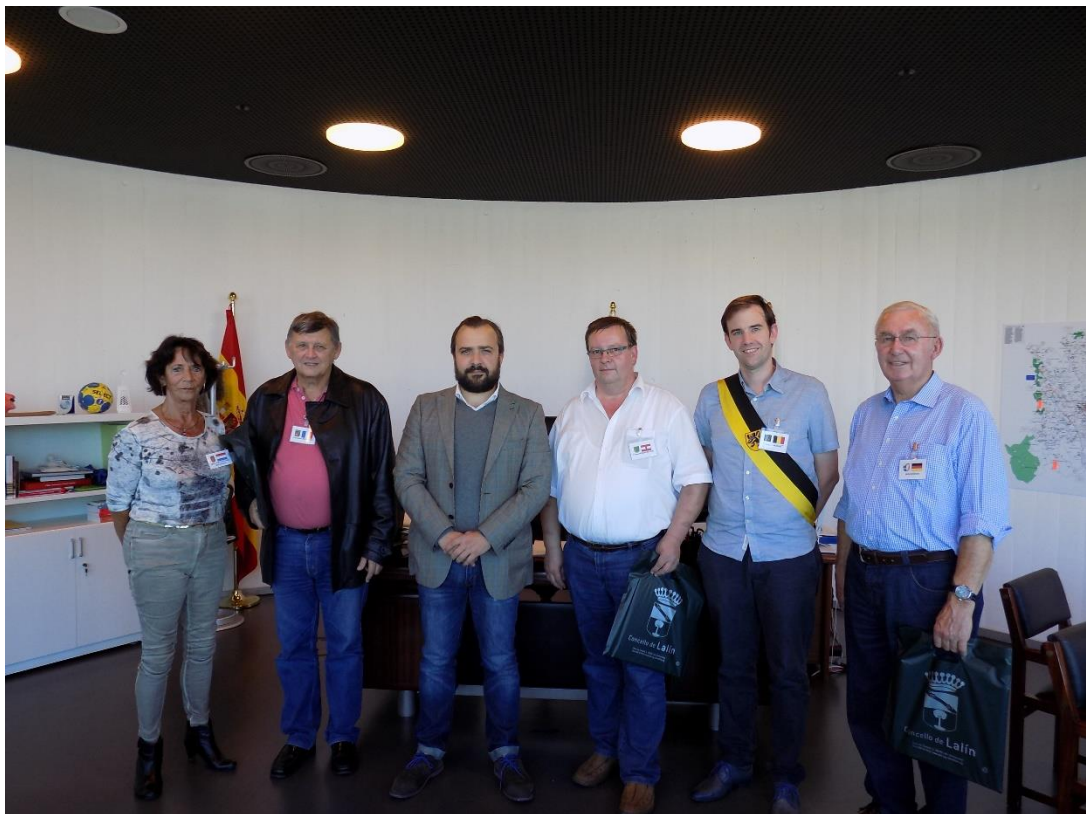
27/10/2016: Alcalde de Lalín con representantes municipales y miembros de "Linden saluda Linden".