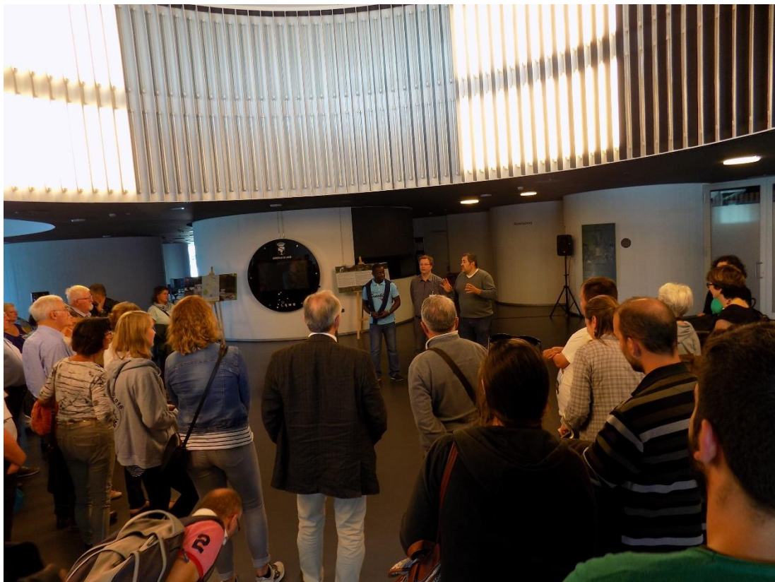
27/10/2016: Visita guiada al Ayuntamiento de Lalín.