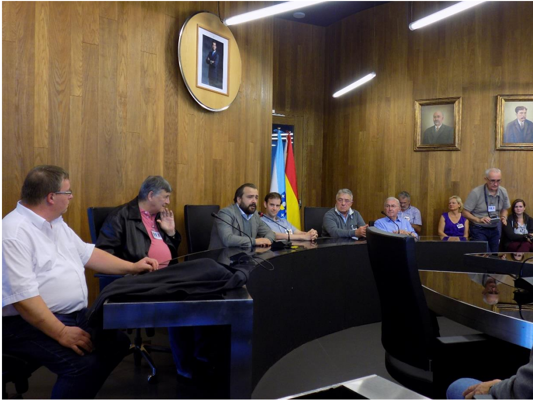
27/10/2016: Bienvenida oficial del Alcalde de Lalín en el Salón de Plenos.