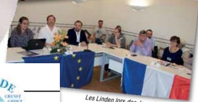
Les Lindens lors des Journées de l'Europe à Lalín en Espagne