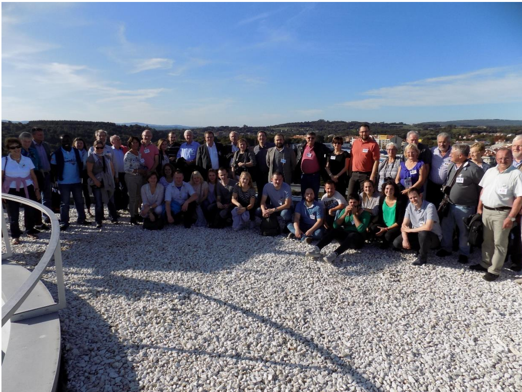
27/10/2016: Foto de grupo en la terraza del Ayuntamiento de Lalín