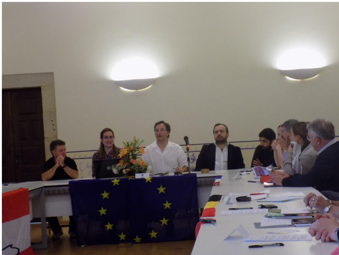
29/10/2016: Reunión de trabajo en el Pazo de Liñares.