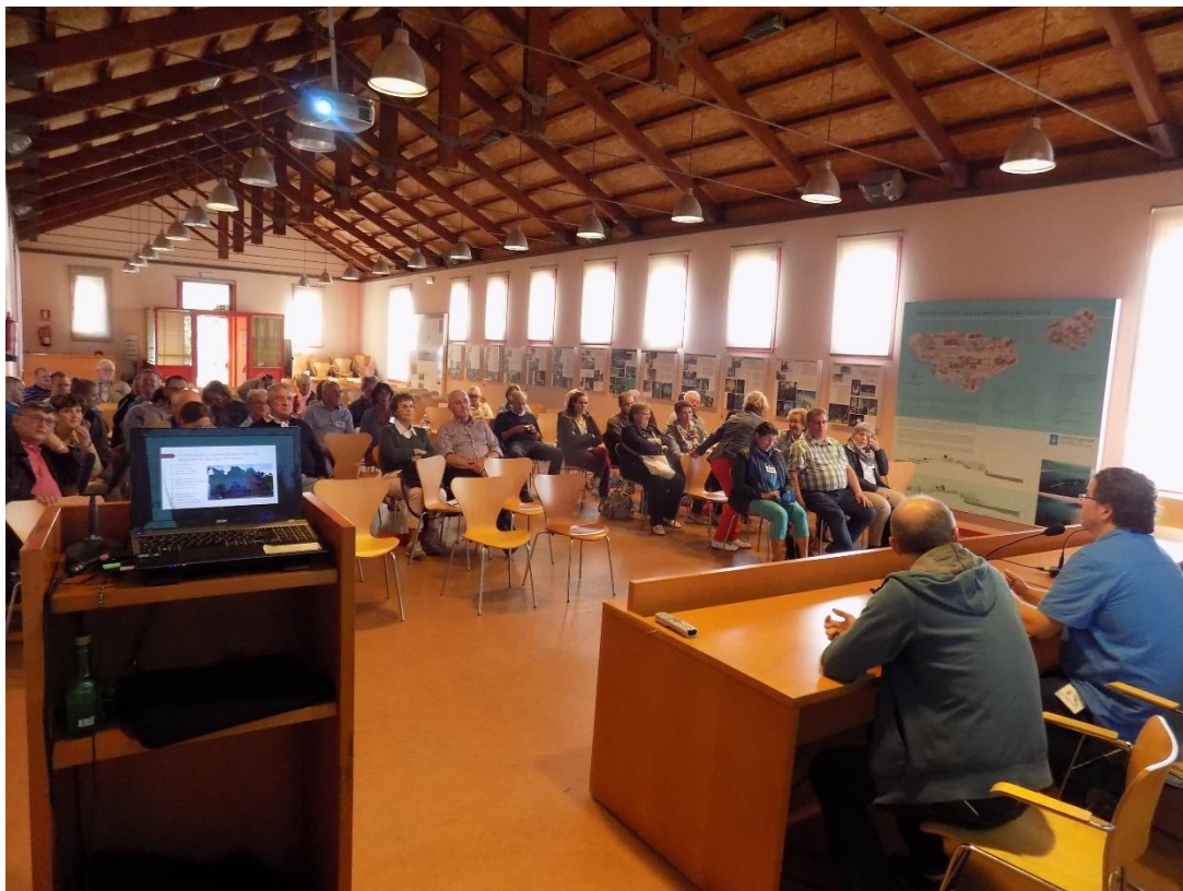
28/10/2016: Presentación de experiencias de acogida de personas refugiadas, Isla de San Simón.