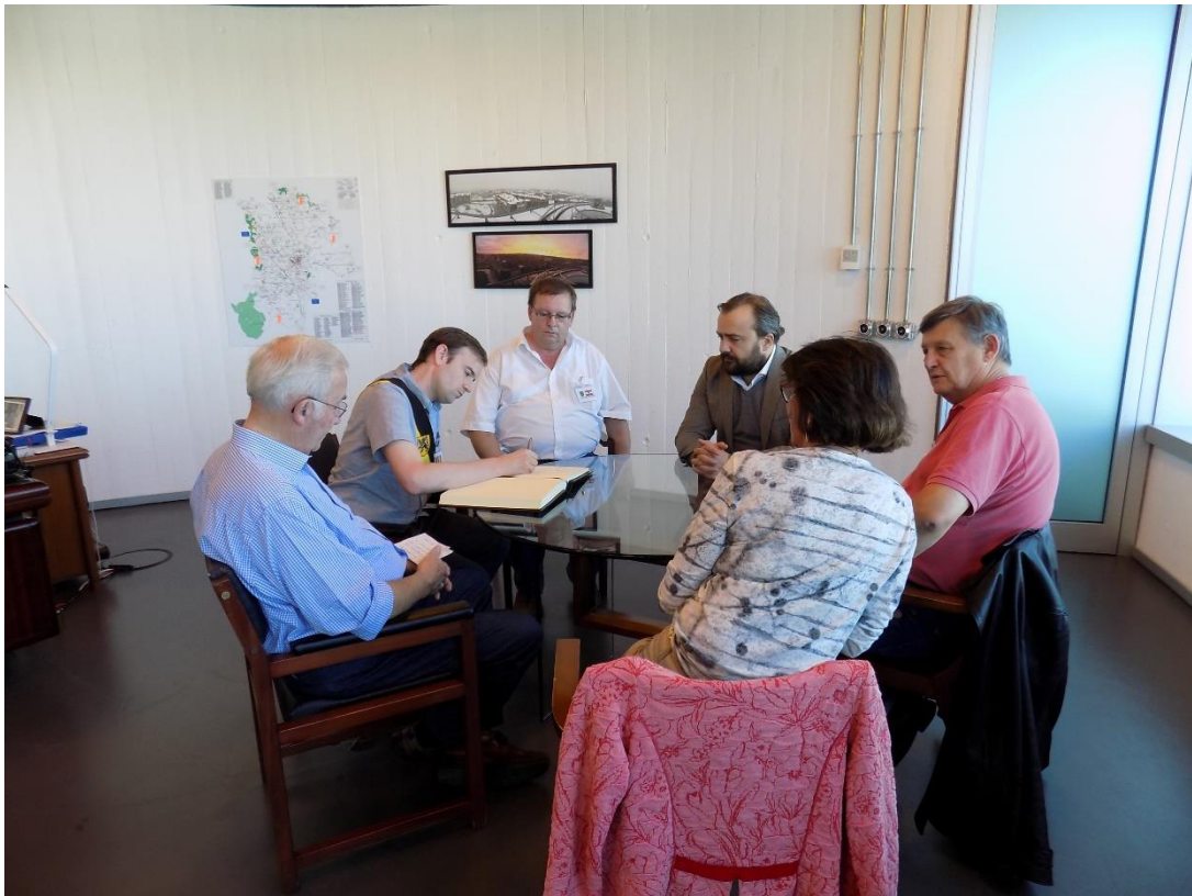
27/10/2016: Firma en el libro de visitas del Ayuntamiento de Lalín.