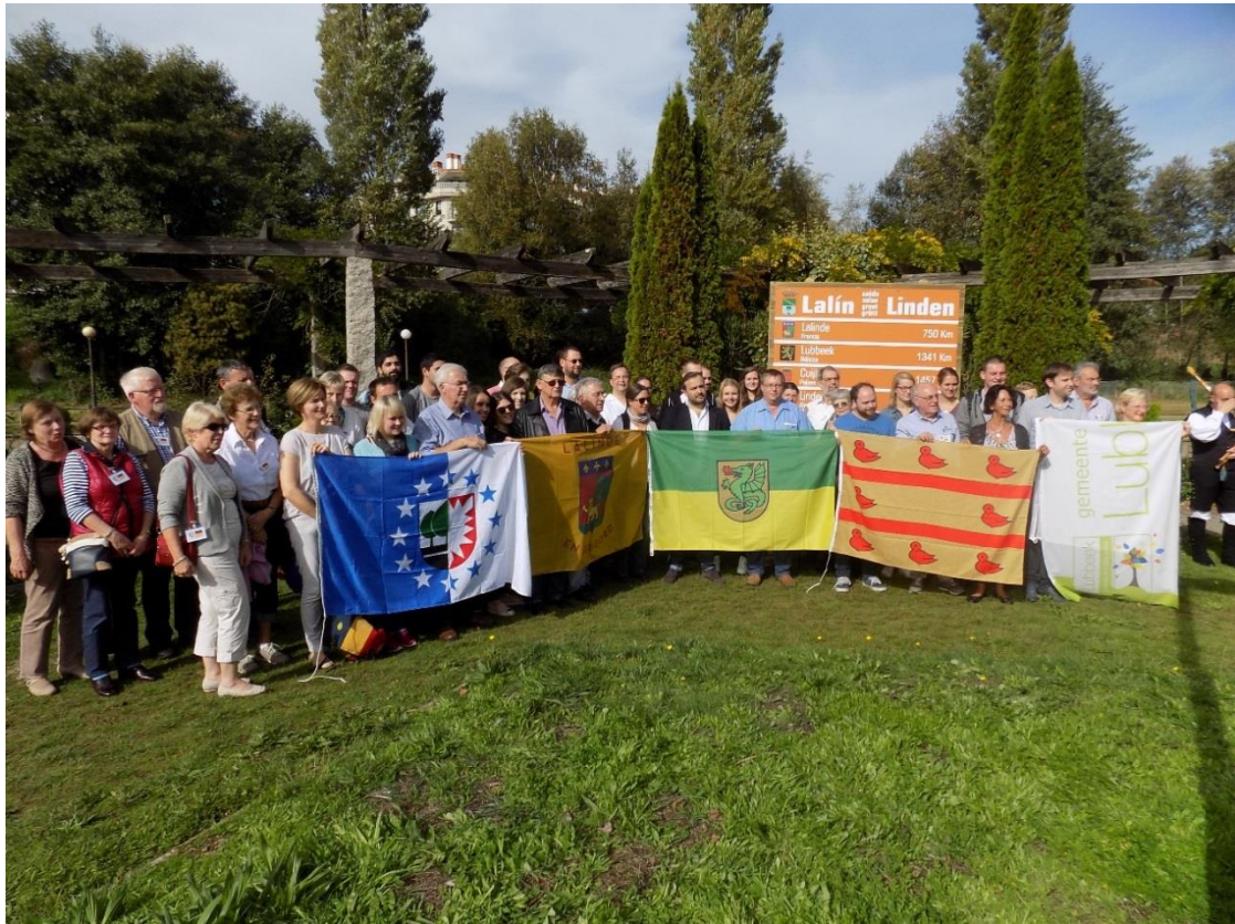
29/10/2016: Grupo de participantes delante del panel de “Lalín saluda Linden”.