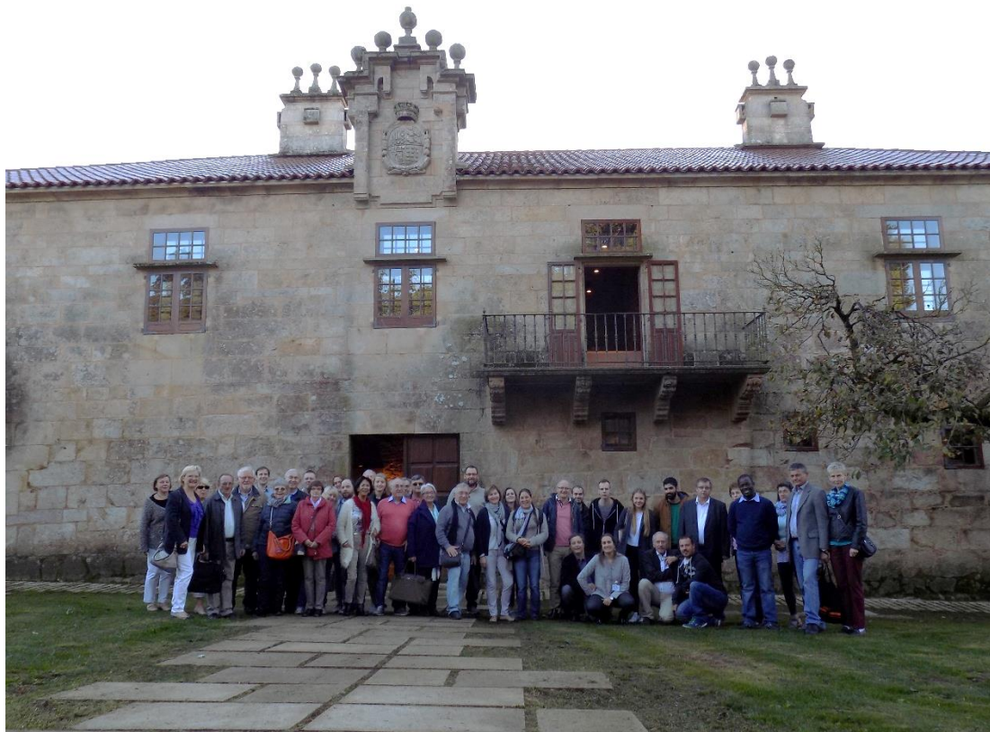
27/10/2016: Grupo de participantes delante del Pazo de Liñares.