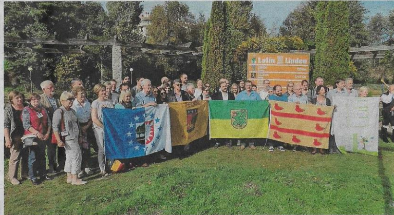
Las delegaciones con los alcaldes y representantes de cada municipio frente al panel conmemorativo.

En la reunión, los asistentes eligieron nuevo presidente interna-