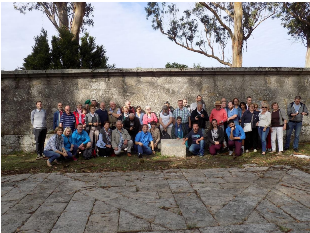
28/10/2016: Grupo de participantes en la isla de San Simón.