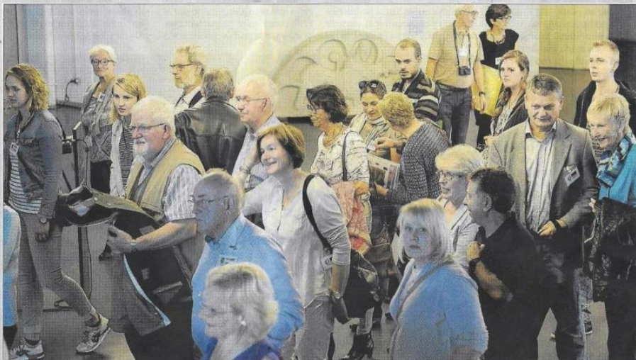
Integrantes del encuentro de villas europeas, ayer, en las instalaciones del Concello de Lalín.

dos durante la Guerra Civil, y otros conflictos bélicos de la reciente historia europea. También está previsto que los participantes en la reunión visiten la ciudad de Vigo antes de regresar a Lalín para pernoctar. El sábado será la última jornada de actividades, con la continuación de la reunión de trabajo "Linden saluda Linden". Las sesiones incluyen las conclusiones de trabajo sectoriales, un debate sobre el modelo de Europa que se quiere mediante la promoción de la ciudadanía europea desde el ámbito local, otro debate sobre los refugiados con propuestas de acción local y la aprobación de las actividades futuras del hermanamiento. La inauguración de un panel conmemorativo y una cena con las familias acogedoras y las autoridades pondrán el broche de oro al encuentro internacional.