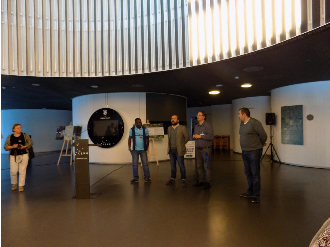
27/10/2016: Recepción del Alcalde de Lalín en el hall del Ayuntamiento.