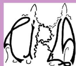
COMITÉ DE IRMANAMENTO DE LALÍN