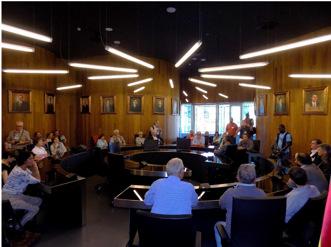
27/10/2016: Recepción del Alcalde de Lalín en el Salón de Plenos.