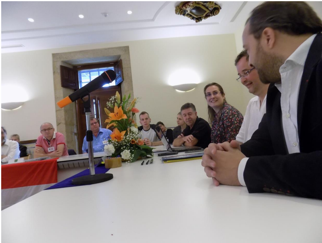
29/10/2016: Reunión de trabajo en el Pazo de Liñares.