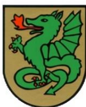
St. Georgen am Walde