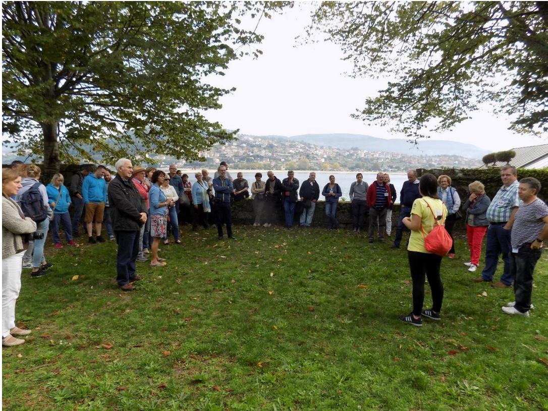
28/10/2016: Visita guiada a la Isla de San Simón.