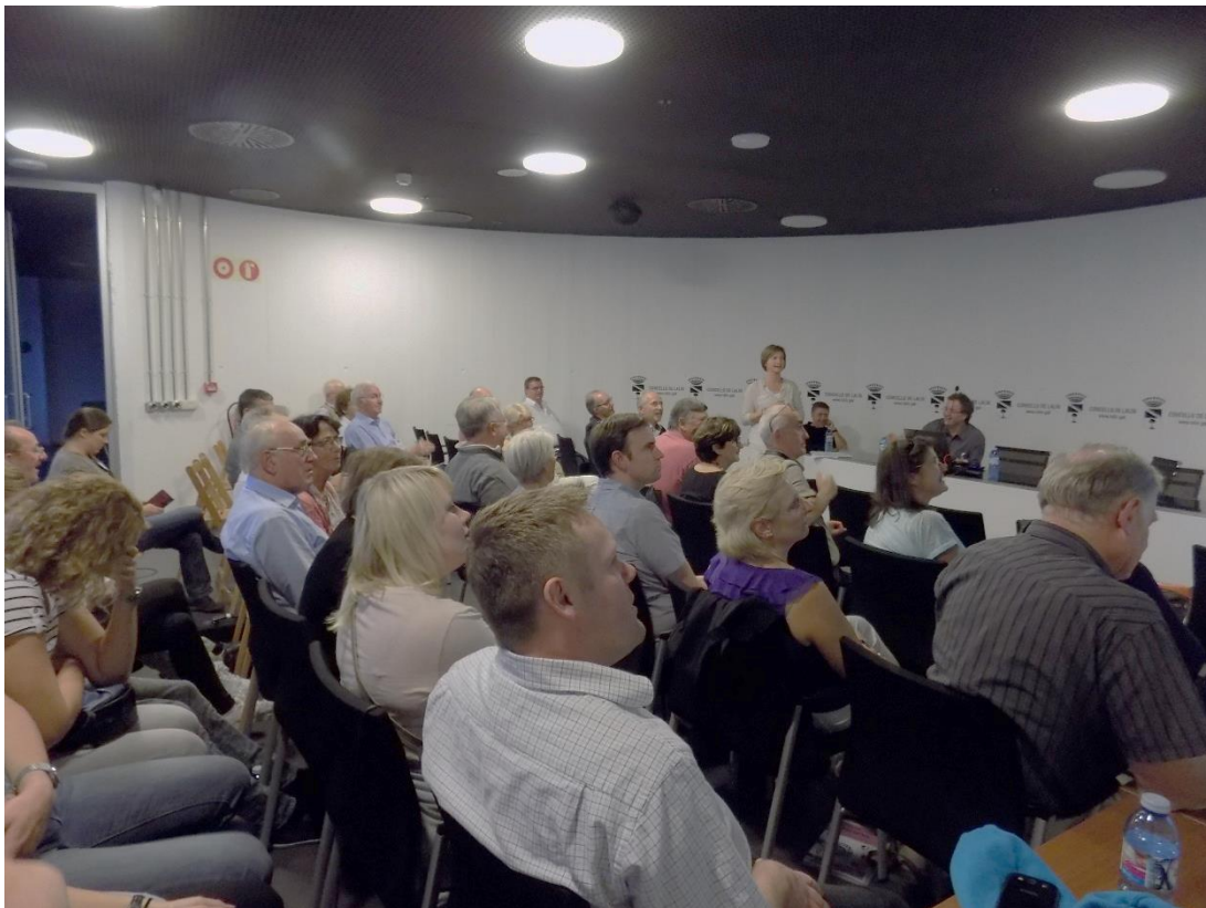
27/10/2016: Presentación de ejemplos de buenas prácticas en participación social solidaria en tiempos de crisis en la Sala de Prensa del Ayuntamiento.