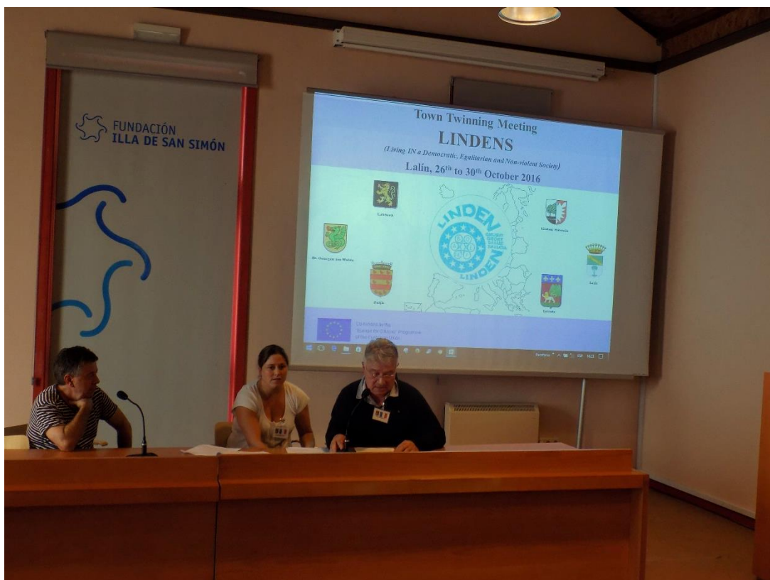
28/10/2016: Presentación de experiencias de acogida de personas refugiadas, Isla de San Simón.