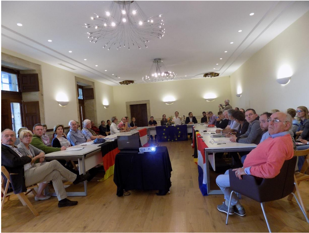
29/10/2016: Reunión de trabajo en el Pazo de Liñares.