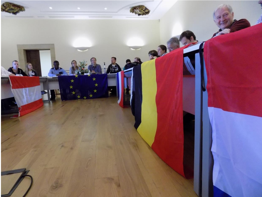
27/10/2016: Reunión de trabajo en el Pazo de Liñares.