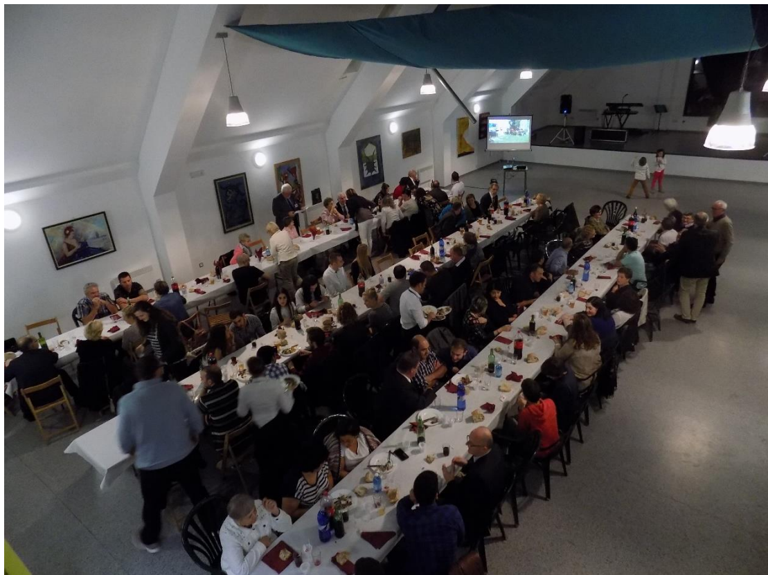
29/10/2016: Cena de convivencia con las familias anfitrionas en el local social de Donramiro.