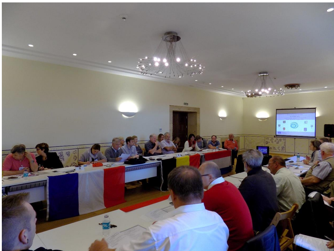
27/10/2016: Reunión de trabajo en el Pazo de Liñares.