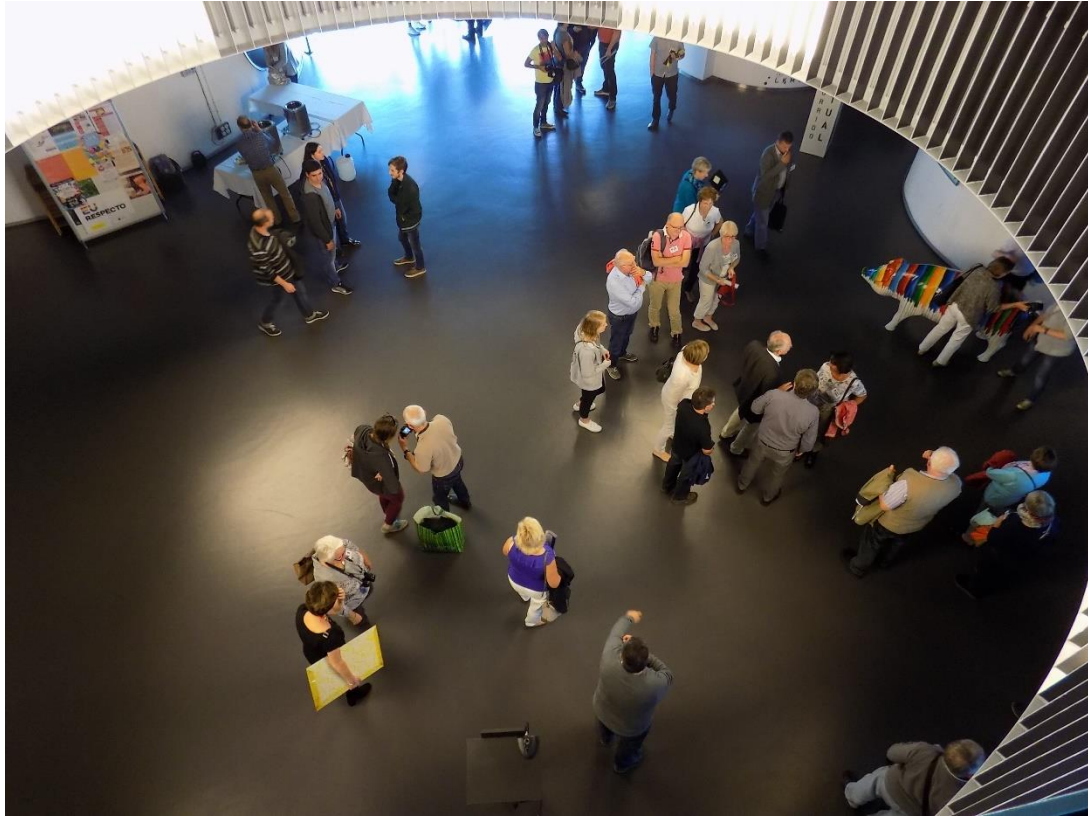
27/10/2016: Recepción en el Ayuntamiento de Lalín.