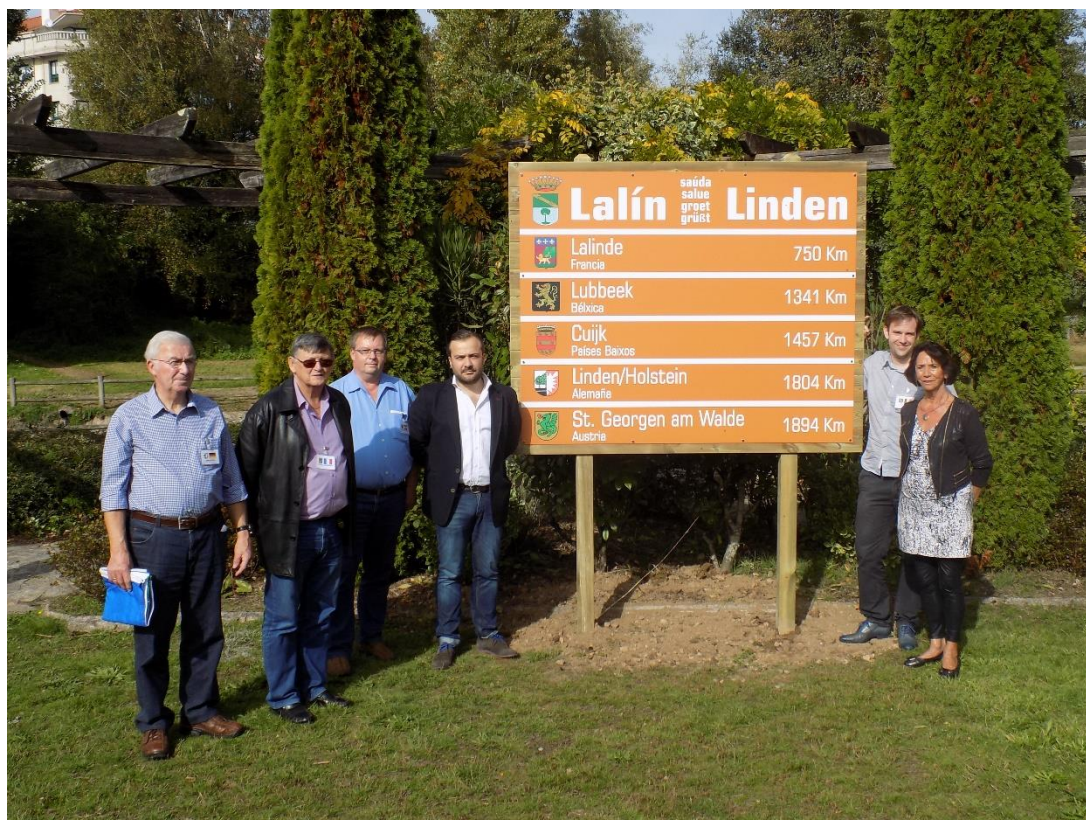
29/10/2016: Alcalde de Lalín y representantes municipales delante del panel de “Lalín saluda Linden”.