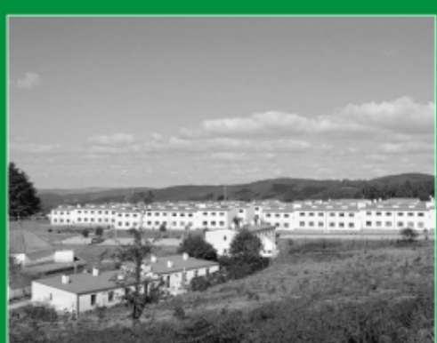
27. Poblado de Fontao. Vila de Cruces