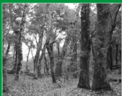
79. Fraga de Catasós. Lalín