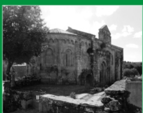
55. San Pedro de Vilanova. Dozón