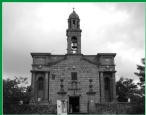
70. Santuario de O Corpiño. Lalín