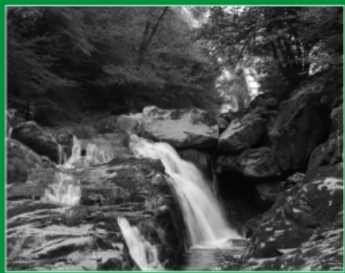
75. Catarata del río Toxa. Silleda