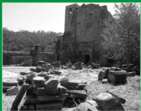
68. Monasterio de Carboeiro. Silleda