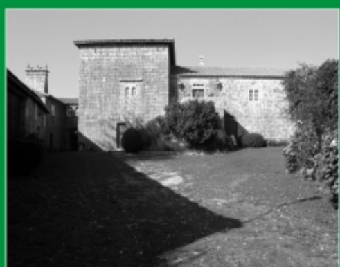
57. Pazo de S. Xoán de Camba. Rodeiro