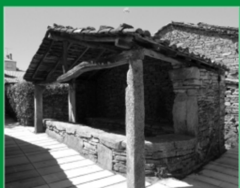
21. Antigo mercado. Agolada