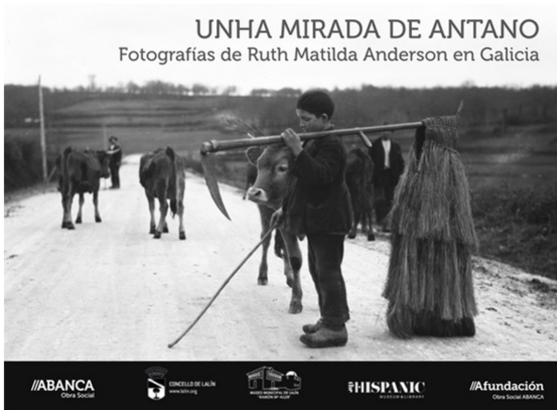
Neno pastor co seu abrigo de palla con carapucho.(coroza), Lalín (Pontevedra), 4 de xaneiro de 1926